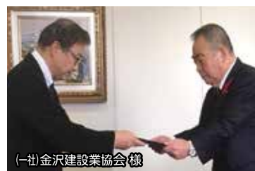
(一社)金沢建設業協会様

企業の社会貢献としてご協力いただきました。また、従業員・職員の方々にも募金の協力を呼び掛けていただきました。