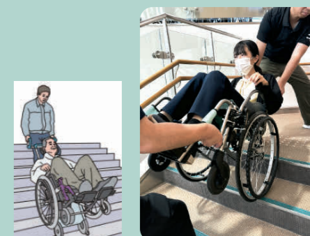
イラスト① 可搬型階段昇降機

車いす利用者の搬送には、「可搬型階段昇降機」という水平移動からそのまま上下移動に切り替えられる機器もあります(イラスト①) ※金沢福祉用具情報プラザには「可搬型階段昇降機」は展示していません。