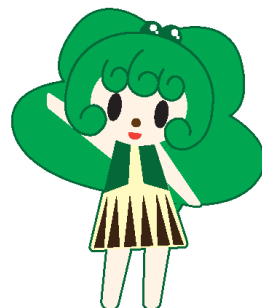
ユースライブラリーコーナー キャラクター：ユメちゃん