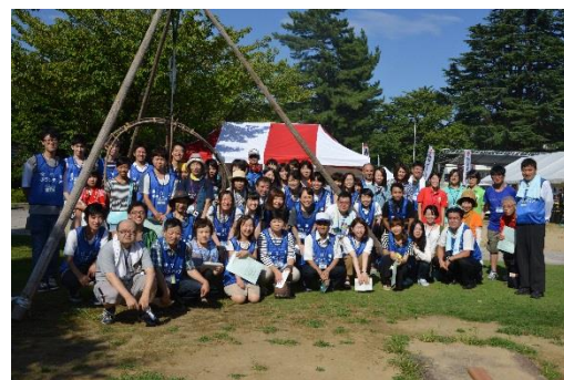
昨年のボランティアのみなさんです。