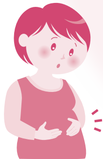
妊産婦・子育てに関するなやみ