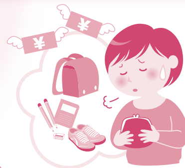
養育に関する経済的問題