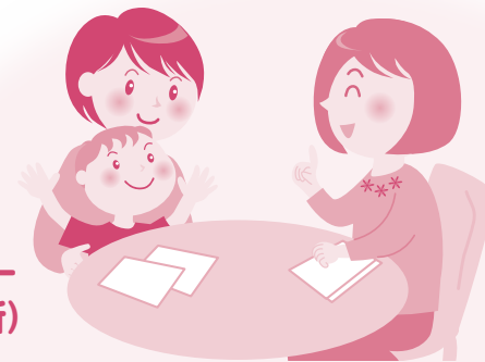
こども総合相談センター(児童相談所)